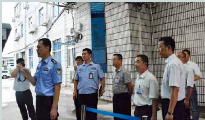
实地考察律师在龙岗看守所办理会见的流程和场景