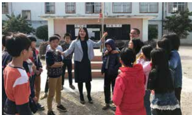
在对口支援村小学里，和孩子们游戏识法

村（社区）法律服务工作很琐碎，往往涉及的是家庭暴力、婚姻、婆媳、邻里、劳动、租赁等，直接面对的是辖区群众，其法律意识相对淡薄，需要社区法律顾问律师耐心倾听、耐心引导、耐心处理，社区法律顾问律师最需要“耐心”。有些社区法律顾问在工作中遇到这些“居委会大妈”的日常事务，失去了工作热情，感觉不到自己存在的意义，萌生离开的念头。究其原因，