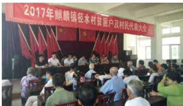
参加村民代表大会

是没有认识到自己工作的价值和空间。社区法律顾问工作是个平台，它给予律师成长的、发展的资源。一个社区是一个市的最基层单元，所有的人、财、物会在社区里流动，社区法律顾问若真诚地为社区付出，社区也会回馈社区法律顾问的这一份辛勤，社区法律顾问就能在社区实现自我，造福一隅。