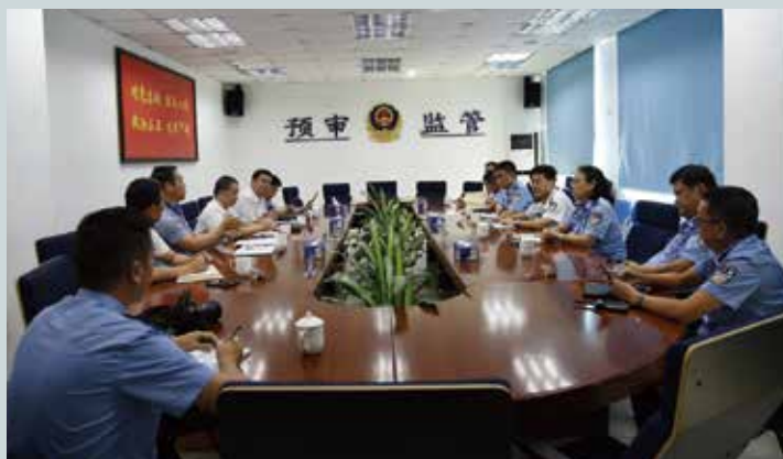
与市公安局预审监管支队召开协调会