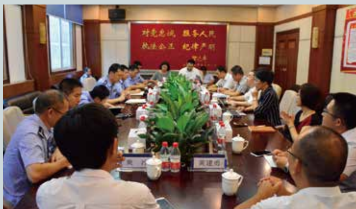
与龙岗看守所座谈