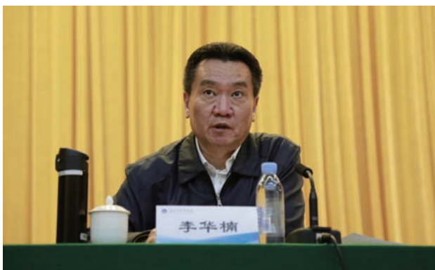
深圳市委副书记、政法委书记 李华楠

他指出，市律协是法定的行业自律性组织，是市委、市政府联系广大律师的桥梁纽带，在团结律师方面负有重要职责。多年来，市律协以高度的使命感和责任感，围绕中心、服务大局，在保障律师执业权利、加强行业自律规范、提高业务创新水平、提升律师队伍素质、参与公益法律服务、扩大行业宣传等方面开展了大量卓有成效的工作，维护了律师界团结和谐、进取向上的良好局面，推动了特区律师事业健康有序发展。面对新形势新任务，市律协要加强政治引领，认真学习贯彻习近平总书记系列重要讲话精神和治国理政新理念新思想新战略，坚持正确的政治方向，团结带领全市广大律师牢固树立政治意识、大局意识、核心意识、看齐意识，把广大律师更加紧密地团结在以习近平总书记为核心的党中央周围。要加强服务意识，建好“律师之家”，当好“律师之友”，认真倾听呼声，满腔热情服务，在律师执业权利受到侵害时，敢于主动发声，增强广大律师对律师协会