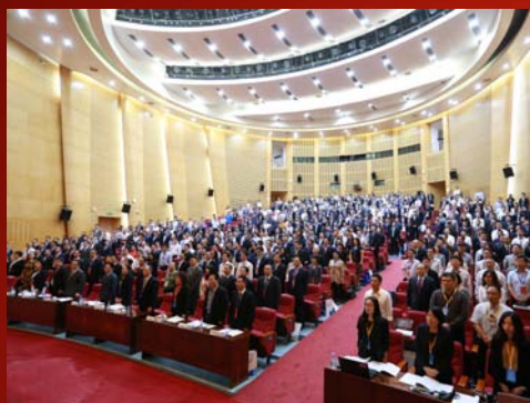
全体代表奏唱国歌