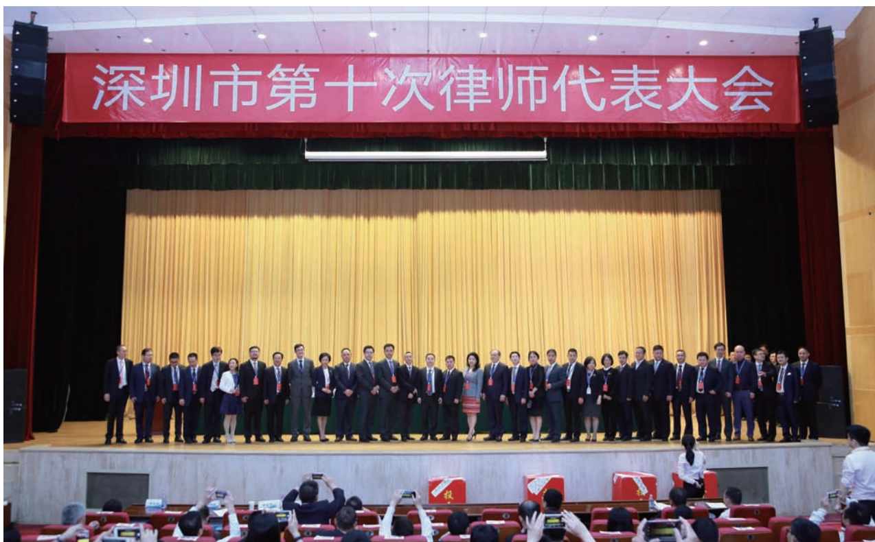
第十届深圳律师协会理事团队合影

我在深圳从事法律工作23年，律师执业19年，我开展过大量社会法律公益活动，有参加社团活动的经验和热情，我是第一批被市律协选派到市政府信访值班的律师。我担任多个政府部门的社会监督员、调解专家、深圳市政府采购评标专家。2008年开始我担任电视台评论员，长期为电视台、报纸等各大媒体作社会评论，让社会听到律师发出的法律人声音，引导民众价值观。律师行业成就了我，现在也是我专业上最成熟、事业上最稳定的时候，我愿意为大家服务，回报我们的行业，我对自己担任理事的要求是为人正直坦诚，说人话不说鬼话，说真话不说假话。