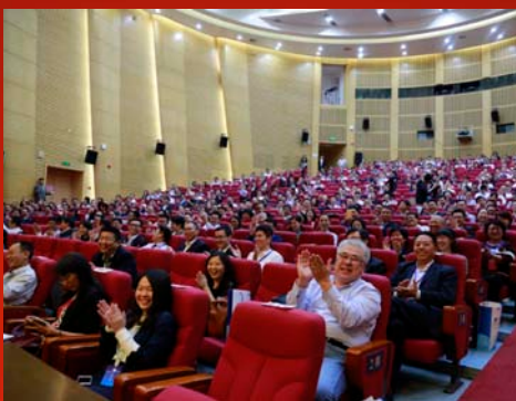
竞选演讲赢得代表掌声