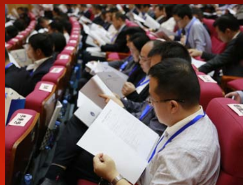
代表认真阅读会议材料