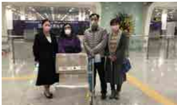
深圳律师为抗击新冠肺炎疫情捐款捐物 700 万余元，彰显大爱和守望相助精神。