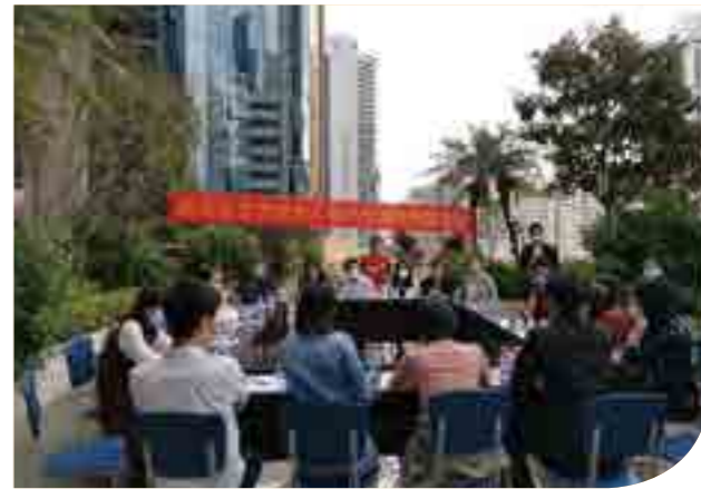
泰和泰（深圳）律师事务所组织“法律服务团”，到南湖街道办事处开展复工复产政策宣讲及热点法律问题咨询工作。

策等多个专业领域，围绕当前疫情中出现的新情况、新问题为企业各项经营管理提供专业解答及建议，力争为一线企业复工复产需求提供精准服务；深圳多家律师事务所也推出相关的法律汇编，比如广东华商律师事务所，组织律师积极撰写 50 余篇抗疫法律文章，汇编成册，形成《“风月同天的解读”——华商抗疫专业呈现》，广东宝城律师事务所法商团队编写《深