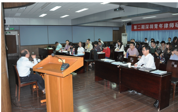
第二期青年律师研修班学员在清华大学学习

持青年律师的培养活动。两年来，深圳律协先后举办两期青年律师研修班、青年律师民事诉讼训练营和刑事辩护训练营，并计划开展青年律师发展论坛、建立青年律师导师制度等一系列活动——这些举措对青年律师的成长和发展无疑具有根本性的帮助。但是要解决青年律师的成长和发展的根本性问题，仅有上述举措是不够的。律师协会不仅要加大对青年律师培养的支持力度，而且要从行业战略规划层面建立和完善青年律师成长和发展制度体系，采取有力措施鼓励律师事务所加大青年律师成长和发展方面的投入，从行业层面为青年律师营造良好的发展环境，从根本上保障青年律师的成长和发展。