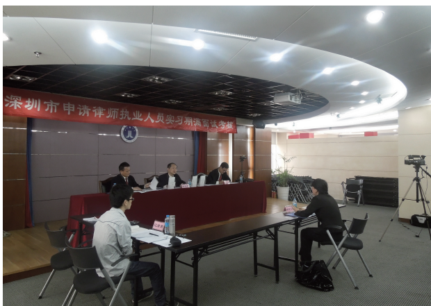
实习人员面试考核现场

现得可左可右的实习人员，其考核结果才可能有不确定性。此次面试从严把关，这一点可能会体现得更加明显。