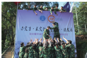
二期班翻越毕业墙