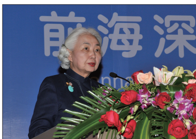
全国人民代表大会常务委员会香港特别行政区基本法委员会副主任委员梁爱诗致辞

粤港律师应把握前海给深圳特区带来的更特殊的先行先试政策，争取深港两地律所建立联营机制，加快建设国际一流现代化产业体系与科技创新体系。香港律师会在《律师行业前海发展研究报告》中提出“紧密联营”模式的构想和混业经营模式的建议，希望在前海试点建立合伙型联营律师事务所，允许内地律师、香港律师共同经营，允许经批准的非律师专业人士、自然人成为该律师事务所的合伙人，参与经营管理事务所；或者聘请非律师管理人参与事务所的管理工作，为客户提供一站式的法律服务。