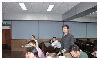
二期班在清华大学学习