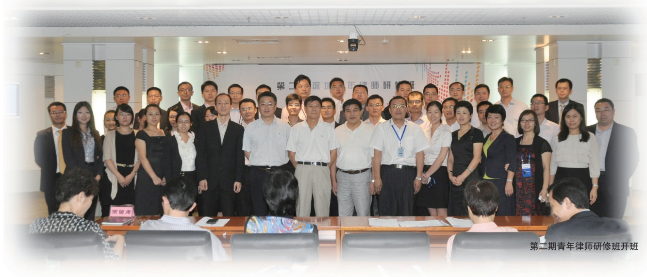
第二期青年律师研修班开班

据了解，很多省市的律师协会均已设立了青年律师工作委员会，其中一些省市还设立了青年律师发展基金，建立了相对完备的青年律师培训体系，为青年律师成长与发展营造了良好的发展环境。以深圳市律师协会为例，深圳律协每年拨付50万元专项基金培养青年律师，此外还给青年律师工作委员会划拨工作经费用于支